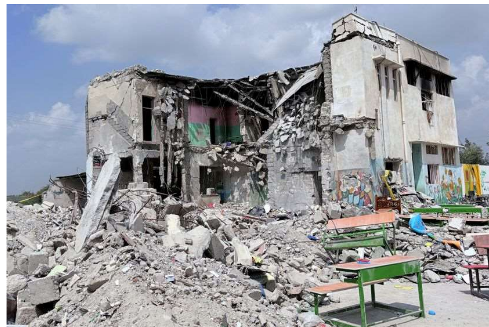
Attaque de l'école de filles à Minab (Iran) samedi 28 février 2026